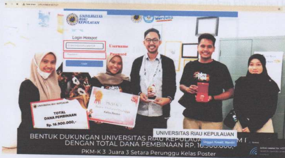
Gambar. Halaman login hotspot UNRIKA